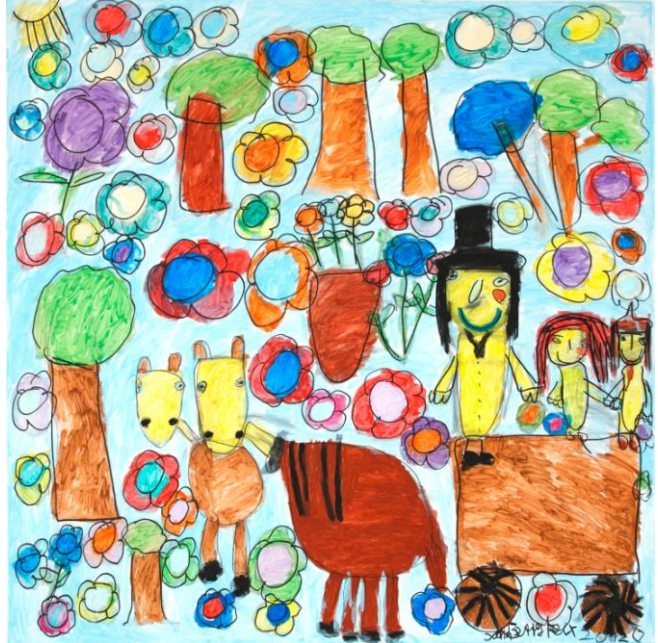
Betty Feix, Hochzeitskutsche, 2012, Mischtechnik, 100x100