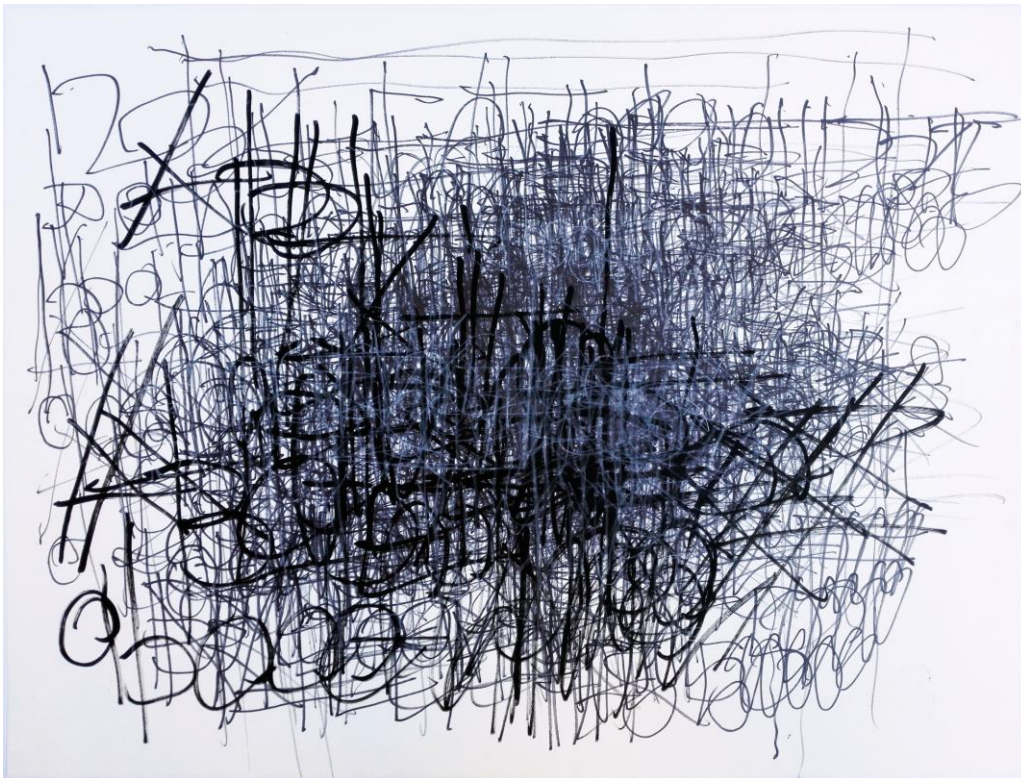
Dan Miller, ohne Titel, 2012 Faserstift und Acryl auf Papier, 76x56

Trägerverein: PS-Art e.V. Berlin Oranienburger Straße 27 10117 Berlin-Mitte