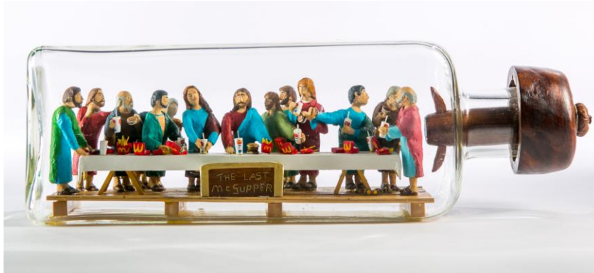
Steve Moseley, The Last McSupper, 2013, Glasflasche, Holz, Mischtechnik, 50x15x12

Für druckfähiges Bildmaterial wenden Sie sich bitte an: galerie@art-cru.de