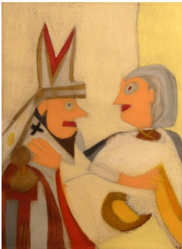
Uwe Paulsen, Papst, 2011 Ölpastellkreide, 50x38