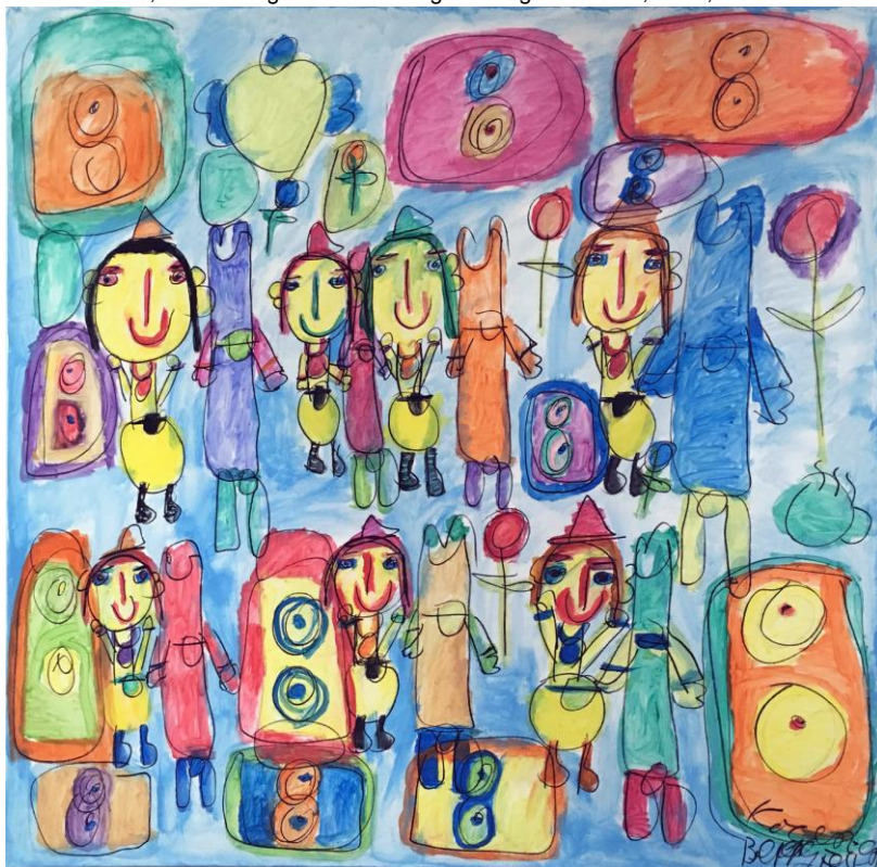
Betty Feix, Konzert, 2018, Acryl auf Leinwand, 100x100

Trägerverein: PS-Art e.V. Berlin Oranienburger Straße 27 10117 Berlin-Mitte