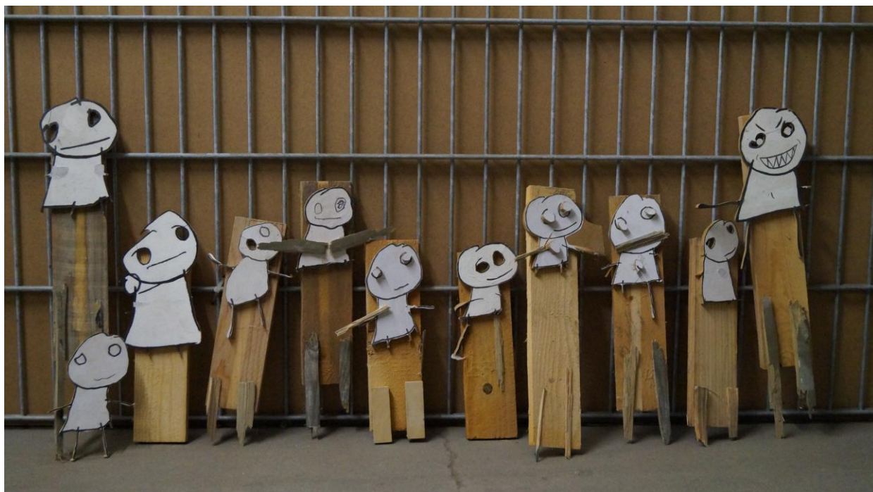
Chriso Lufundiso Luanza, Einzelne Figuren, 2015, MDF-Figuren und Naturholz, ca. 30 bis 50cm