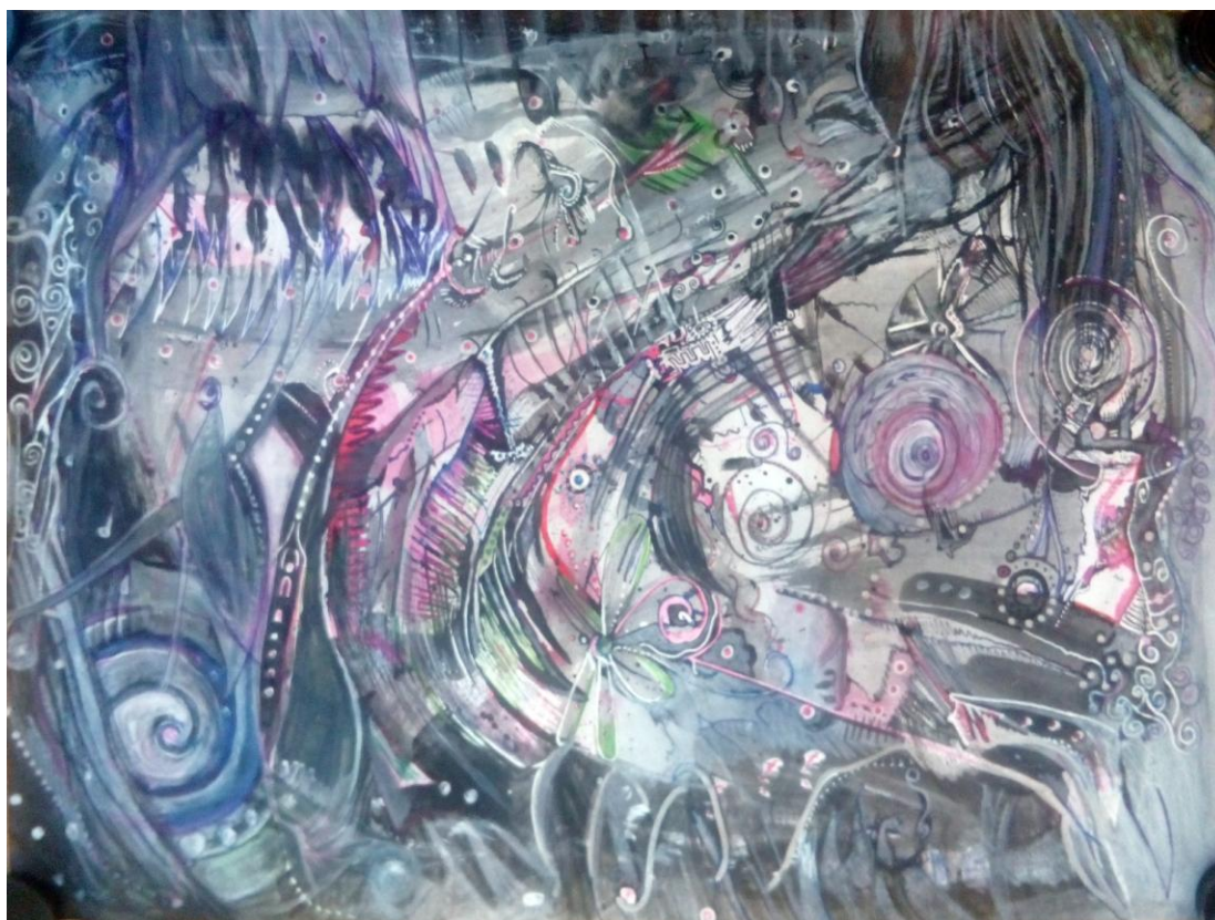
Melanie Edwards, Sanfte Spiralen in Grau, o.J. Mischtechnik, Tinte, Acryl, Tipp-Ex, Kugelschreiber

Trägerverein: PS-Art e.V. Berlin Oranienburger Straße 27 10117 Berlin-Mitte