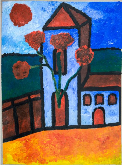
O.T., 2016, Zeichenkohle und Acrylfarbe auf Malerpappe, 78x58

Für druckfähiges Bildmaterial wenden Sie sich bitte an: galerie@art-cru.de