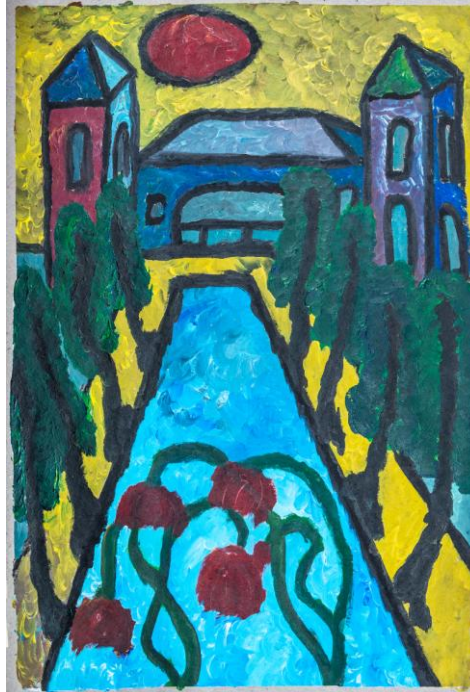
O.T., 2016, Zeichenkohle und Acrylfarbe auf Malerpappe, 78x56