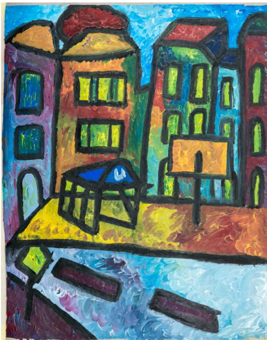
O.T., 2016, Zeichenkohle und Acrylfarbe auf Malerpappe, 79x60