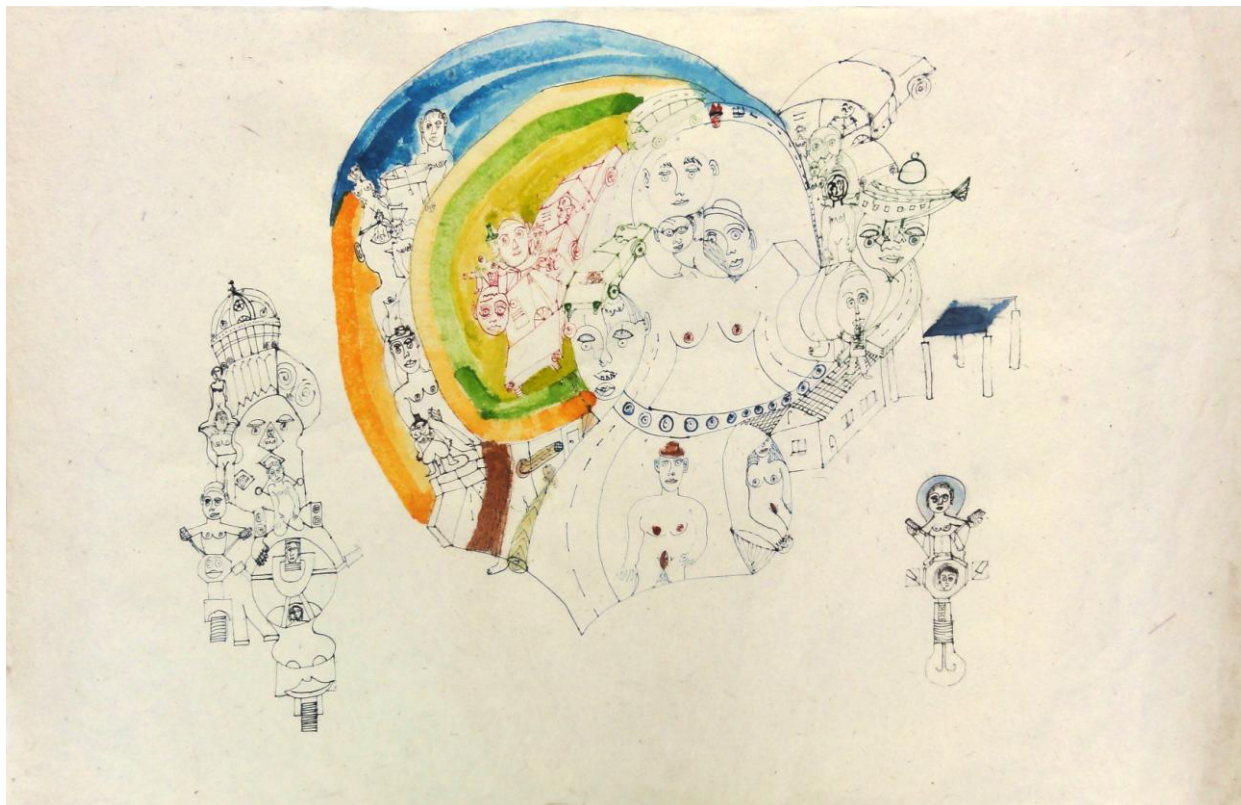
Alexander Kurfürst, o.T.,o.J., Fasermaler, Auarell, 51x76

Für druckfähiges Bildmaterial wenden Sie sich bitte an: galerie@art-cru.de