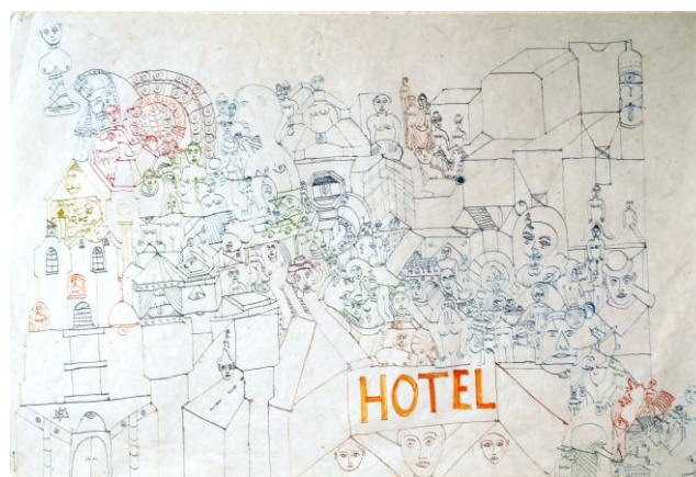
Alexander Kurfürst, o.T.,o.J., Fasermaler, Auarell, 51x76

Trägerverein: PS-Art e.V. Berlin Oranienburger Straße 27 10117 Berlin-Mitte