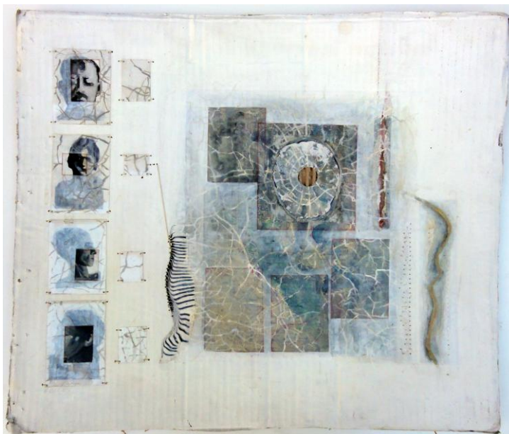
Katinka Kaskeline, O.T., 2013, Collage, Kunststoffolie, Motten ausgeschnittene Buchillustrationen, Landkarte, Bindfaden, 44,5x51,5

Trägerverein: PS-Art e.V. Berlin Oranienburger Straße 27 10117 Berlin-Mitte