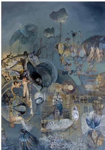
Katinka Kaskeline, O.T., 2017, Acryl, Transparentpapier, ausgeschnittene Buchillustrationen, Zeichentusche auf Holz, 60x42