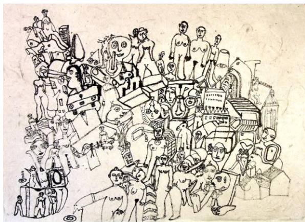
Alexander Kurfürst, o.T.,o.J., Kreide, 50x68