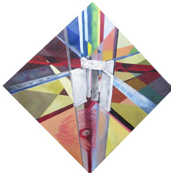
J.F. Chambel Marques, Geo.R.Gia, 2013 Öl auf Leinwand, 90x90,