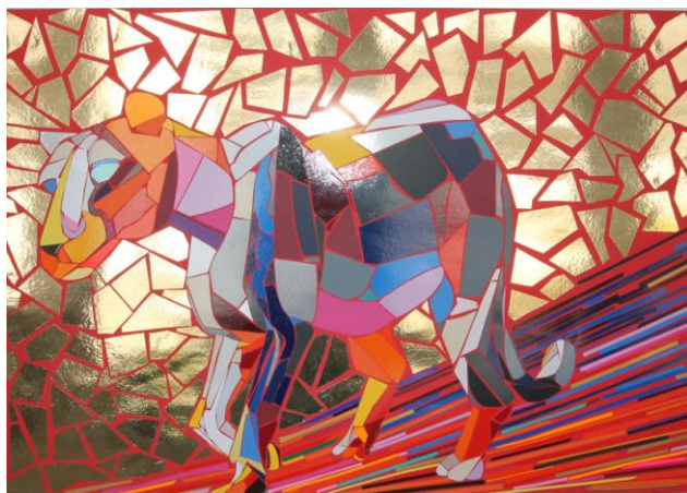
Marco Bukschat, Leopard, 2014, Folie auf Fotokarton, 70x100