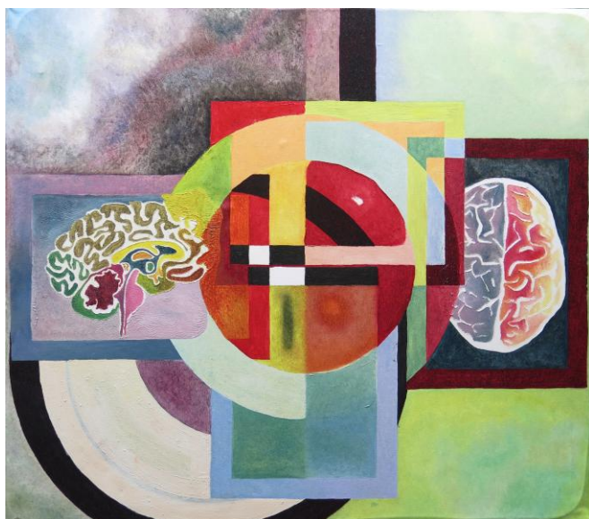
J.F. Chambel Marques, Um Zero, 2013, Öl auf Leinwand, 74x83

Für druckfähiges Bildmaterial wenden Sie sich bitte an: galerie@art-cru.de