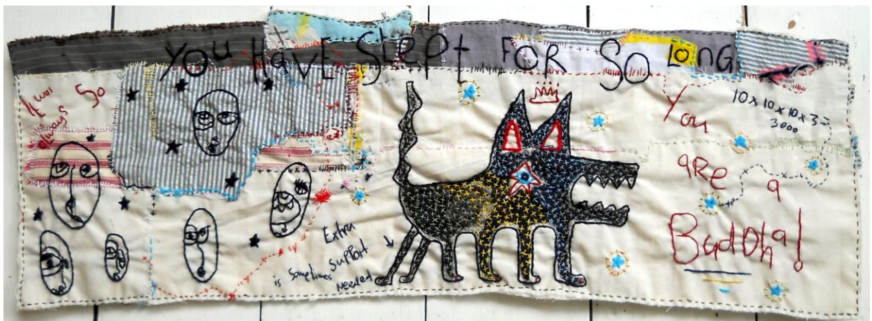
Wake Up!!!, verschiedene Textilien, Handstickerei, schwarze Tinte, 24x69

Trägerverein: PS-Art e.V. Berlin Oranienburger Straße 27 10117 Berlin-Mitte