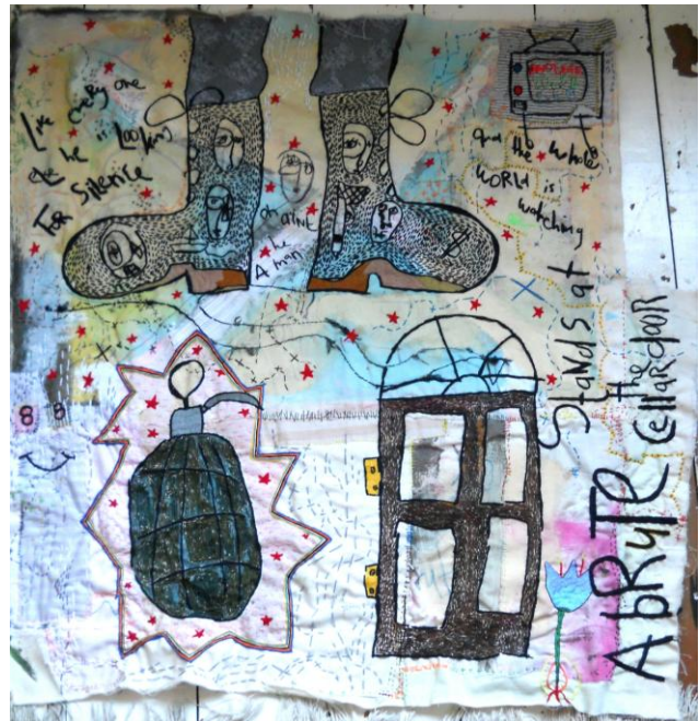
Brute Force, verschiedene Textilien, Handstickerei, Acryl, 72x75