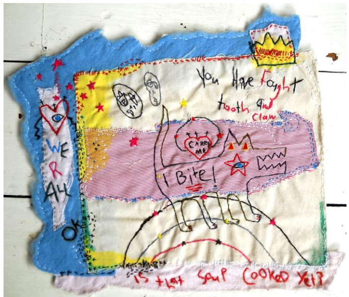
Is it cooked yet, verschiedene Textilien, Handstickerei, Acryl, 28x30

Trägerverein: PS-Art e.V. Berlin Oranienburger Straße 27 10117 Berlin-Mitte