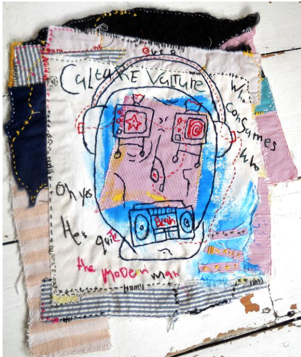
Modern Man, verschiedene Textilien, Handstickerei Acryl, 33x28,

Für druckfähiges Bildmaterial wenden Sie sich bitte an: galerie@art-cru.de