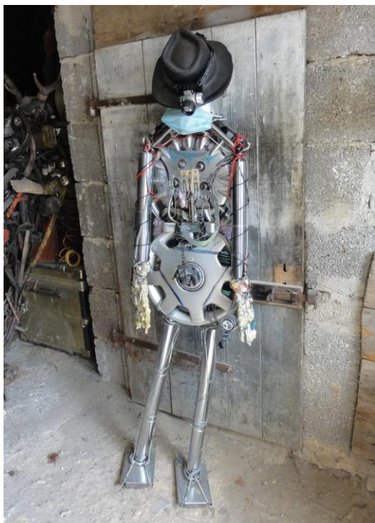
Michael Jackson, 2008, Assemblage, 157x67x64

Für druckfähiges Bildmaterial wenden Sie sich bitte an: galerie@art-cru.de