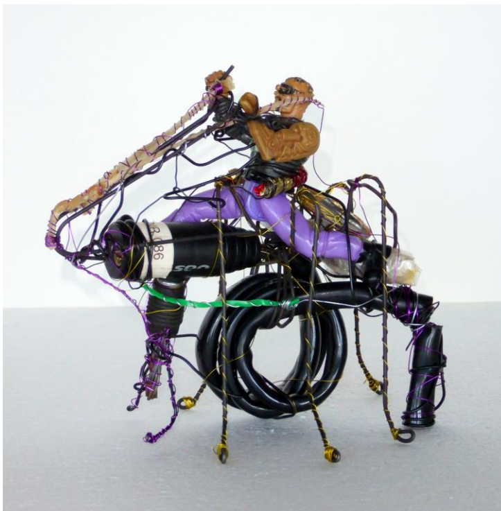
Schlossbefreiungsfahrer, 2017, Assemblage, 14x13x17