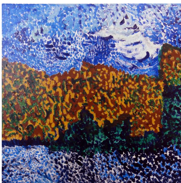
Beatrice Guder, Wald, 2016 Acryl auf Leinwand, 50x50

Trägerverein: PS-Art e.V. Berlin Oranienburger Straße 27 10117 Berlin-Mitte