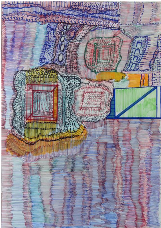
Haci Sami Yaman, Konstante, 2018, Faserstift auf Papier, 82x60

Für druckfähiges Bildmaterial wenden Sie sich bitte an: galerie@art-cru.de