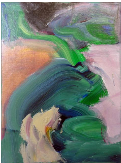
Beatrice Guder, Farbenspiel, 2018, Acryl auf Leinwand, 24x18