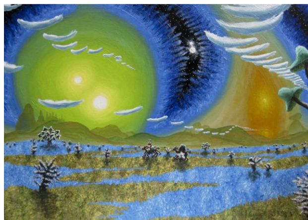
Andrea Rausch, Gemütlicher Ritt über die Pampa unterm Ozonloch, 1999, Acryl auf Leinwand, 60x80

Trägerverein: PS-Art e.V. Berlin Oranienburger Straße 27 10117 Berlin-Mitte