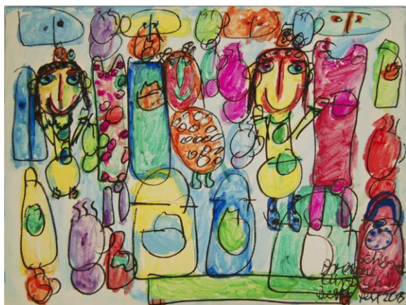
Betty Feix, Mein schöner Prinz, 2013, Mischtechnik, 30x40