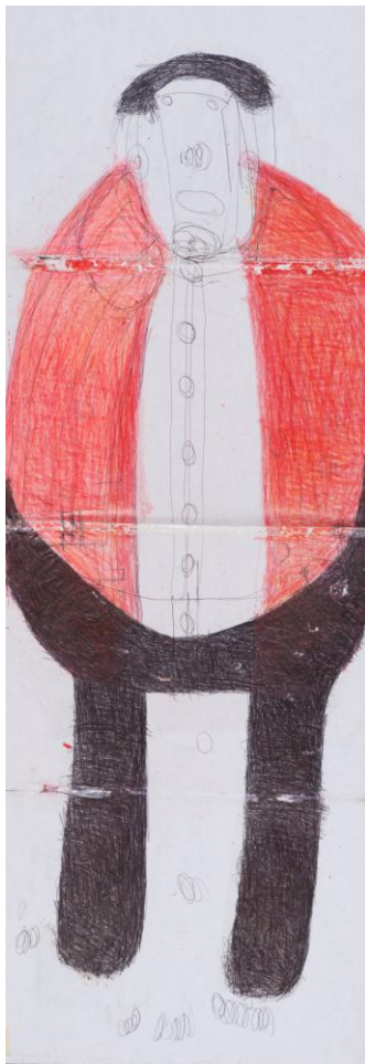
o.T., undatiert, Kugelschreiber, Ölpastellkreide, 41,5x116,5 Vorderseite