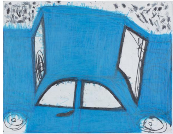
o.T., undatiert, Ölpastellkreide, Filzstift, 68x50