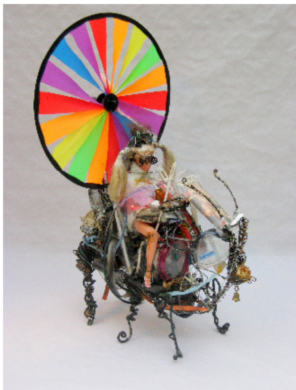
Die Kleine aus Essen , 2008, Assemblage, 51x30x38