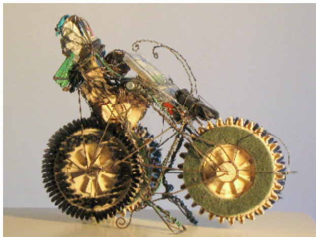
Große Freiheit , 2012, Assemblage, 31x13x15

Für druckfähiges Bildmaterial wenden Sie sich bitte an: galerie@art-cru.de