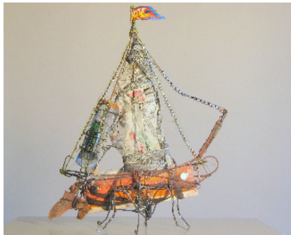
Allgäuer Danielo-Schiff , 2010, Assemblage 15x33x25