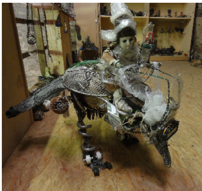
Schnelle Susi , 2009, Assemblage, 68x73x95

Für druckfähiges Bildmaterial wenden Sie sich bitte an: galerie@art-cru.de