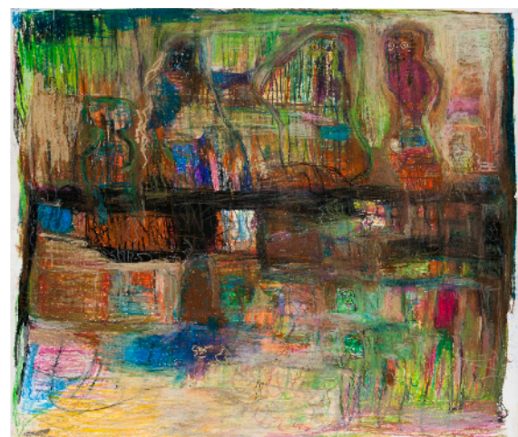
Peter Pankow: Schauspieler 3, 2012, Wachsstift 151x159cm

Trägerverein: PS-Art e.V. Berlin Oranienburger Straße 27 10117 Berlin-Mitte