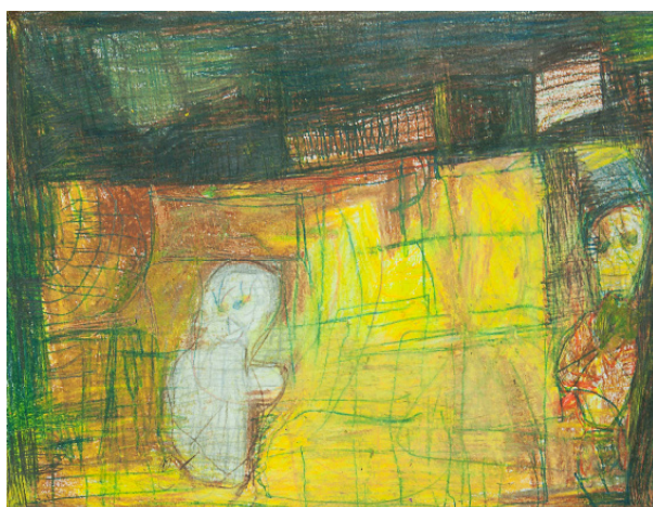
Peter Pankow: o.T., 2010, Wachsstift, 30x42cm