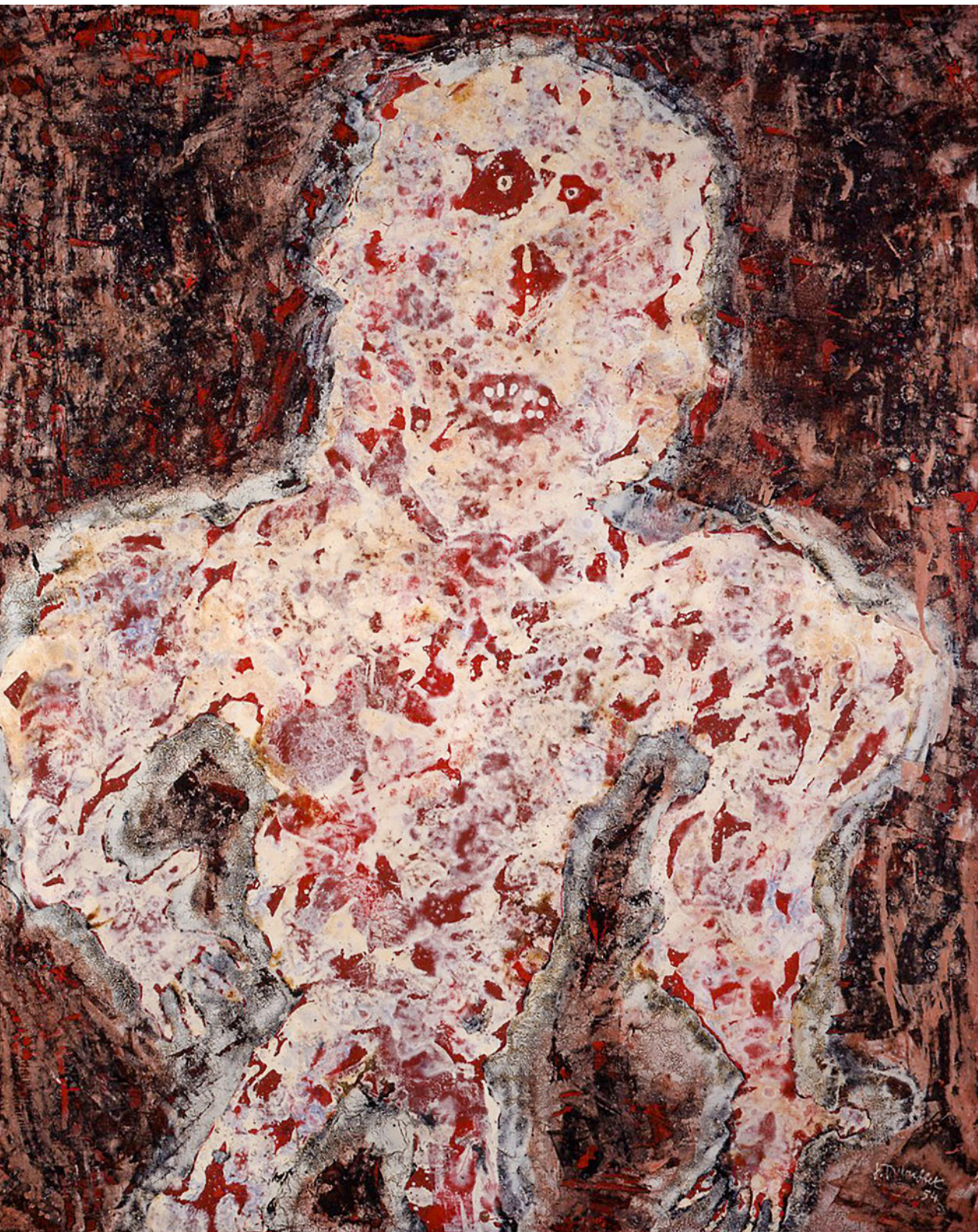
Jean Dubuffet, Intervention , 1954, Öl auf Leinwand 100 × 81 cm, Foto: Serge Hasenböhler, Basel, Courtesy: Galerie Karsten Greve, Köln | Paris | St. Moritz