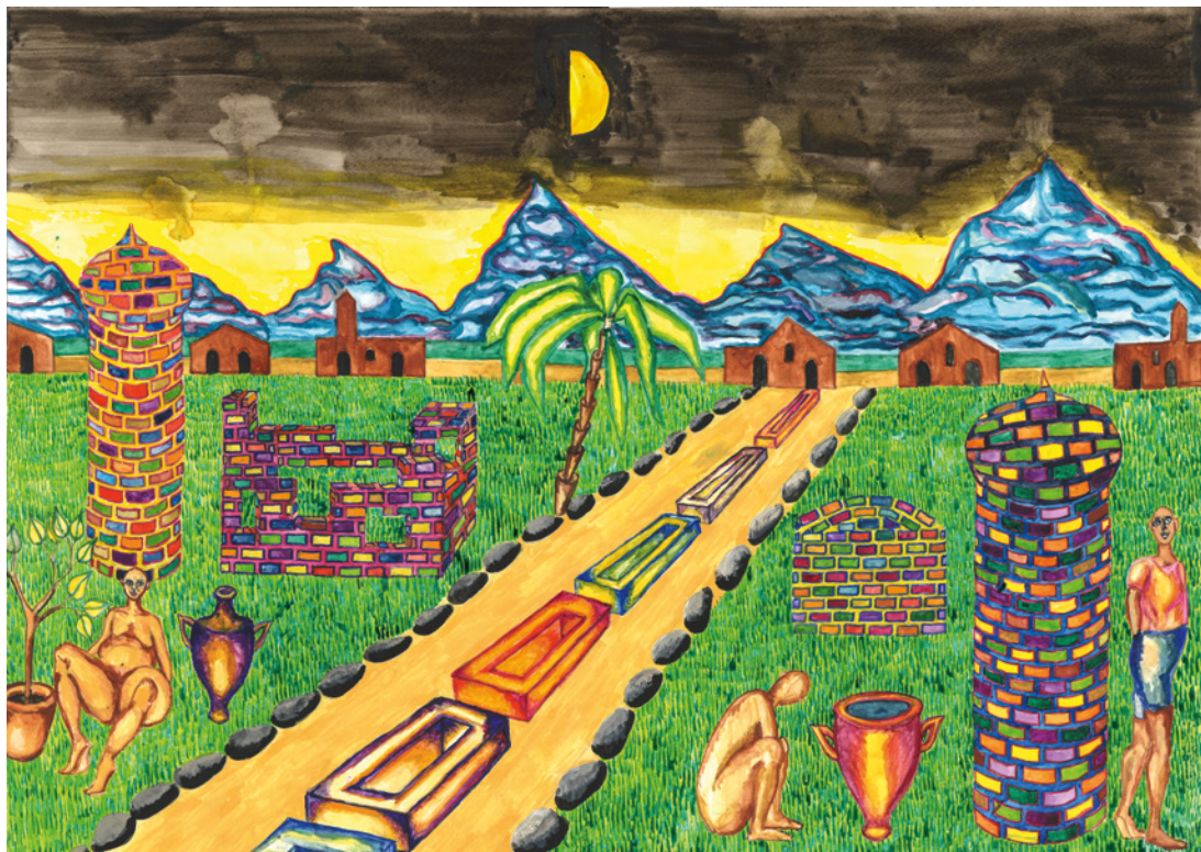
Sonja Halbfass, Nachtvision , 2025, Aquarell, 59 × 42 cm, © Courtesy: Galerie ART CRU Berlin, Sonja Halbfass