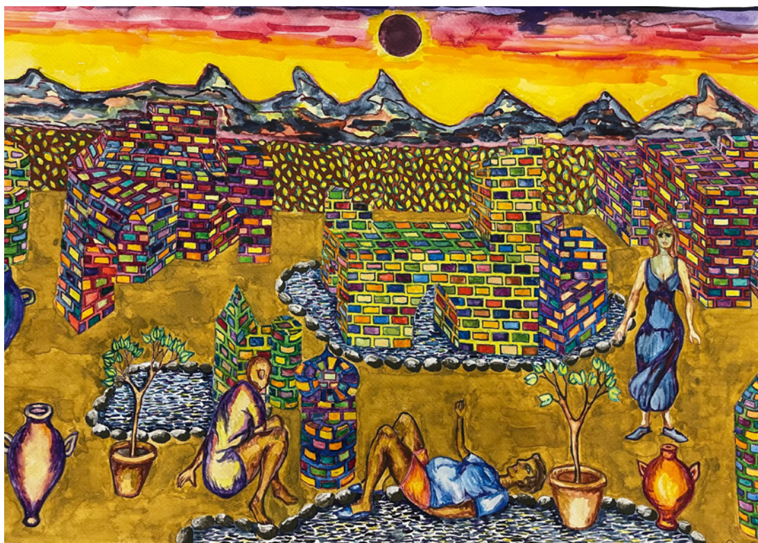
Sonja Halbfass, Orientalische Seen , 2023, 42 × 59 cm, Mischtechnik, © Courtesy: Galerie ART CRU Berlin, Sonja Halbfass