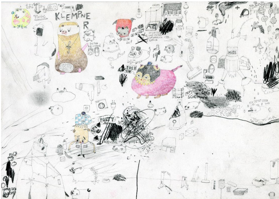
Amelie Bartelsen, o. D., o. T., Mischtechnik, 21x30 cm

PS-Art e.V. Berlin IBAN: DE46 3702 0500 0001 0826 00 BIC: BFSWDE33XXX SozialBank