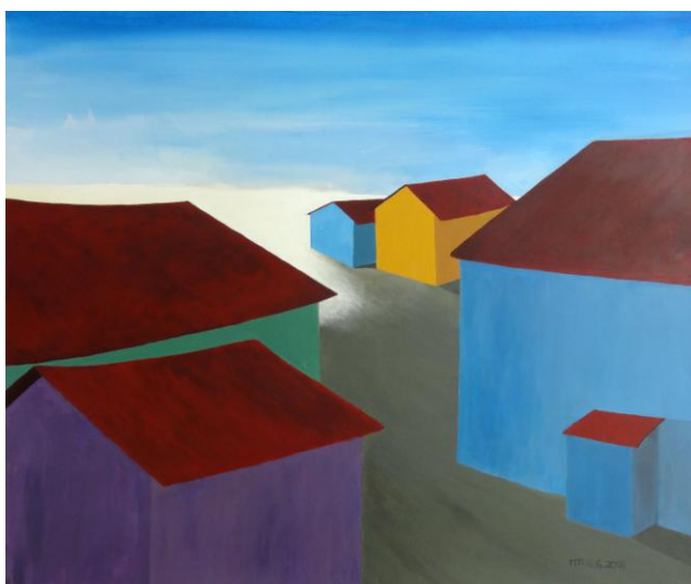
Martin Nieder, Vergossenes Licht, 2018 Acryl auf Leinwand, 60x70