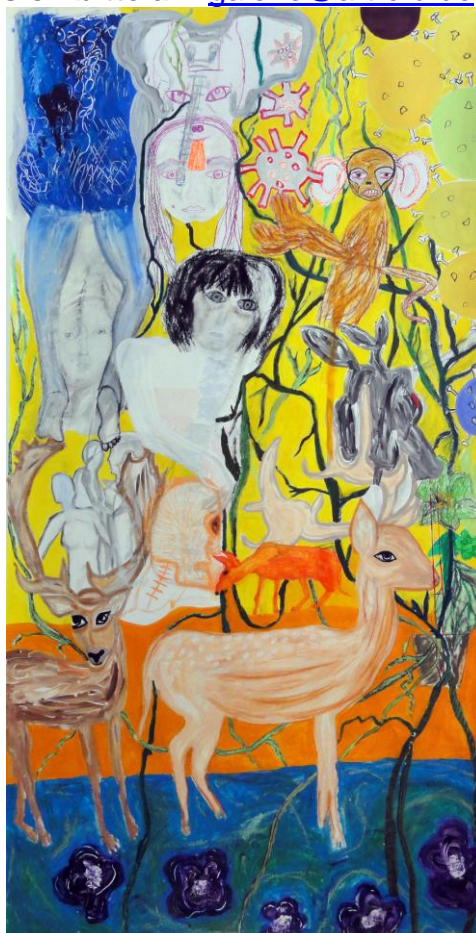
Belhe Zaimoglu, Corona, 2020 Mischtechnik, 260x124