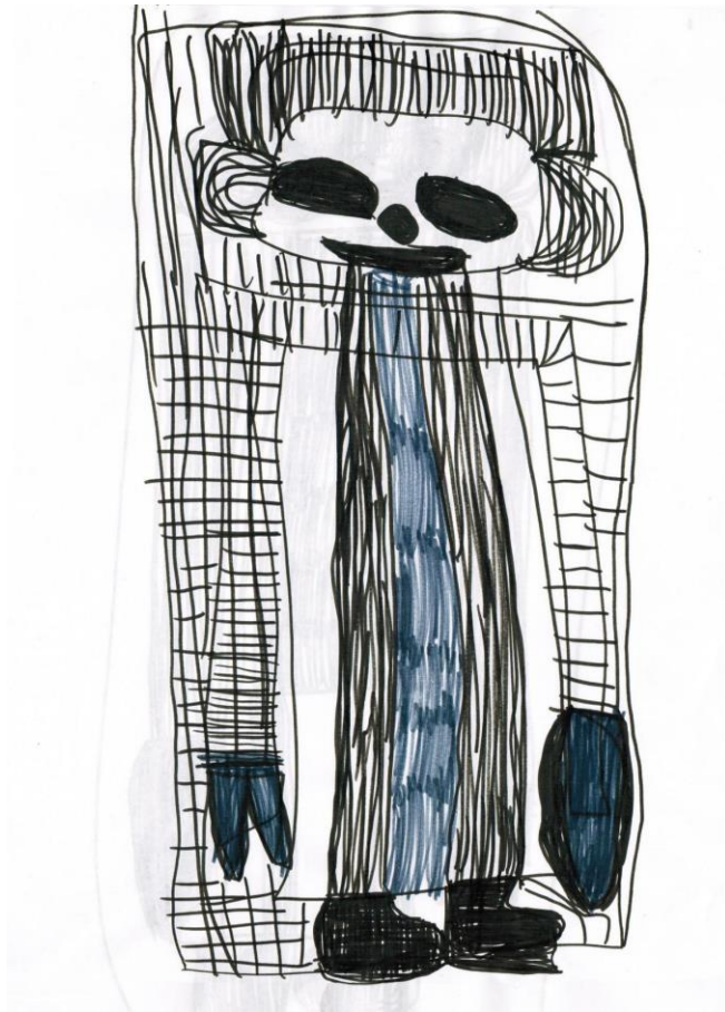
O.T., o.D., Fasermaler, 42x30