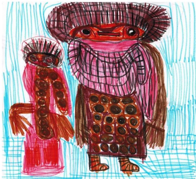
O.T., o.D., Fasermaler, Kugelschreiber, 20x22