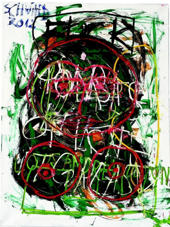
Karl-Heinz Schwind, O. T., 2012, Öl auf Leinwand, 90x121 cm