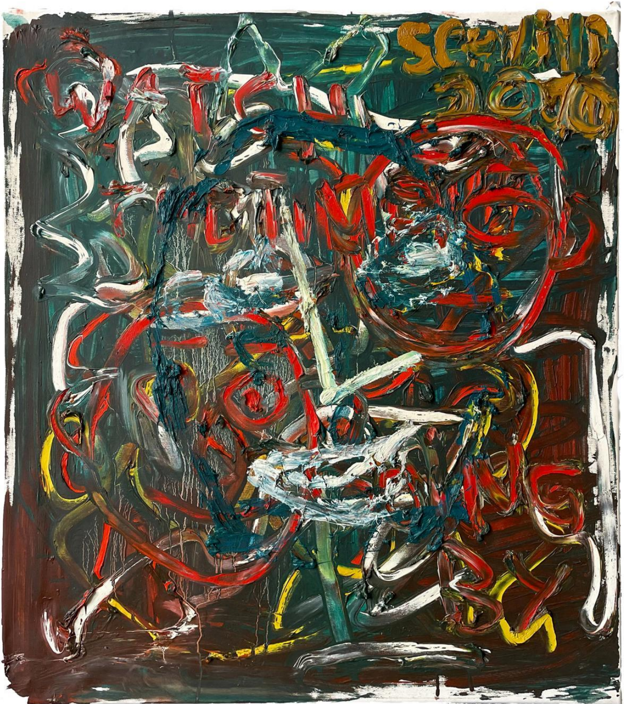
Karl-Heinz Schwind, O. T., 2010, Öl auf Leinwand, 80 x 70 cm