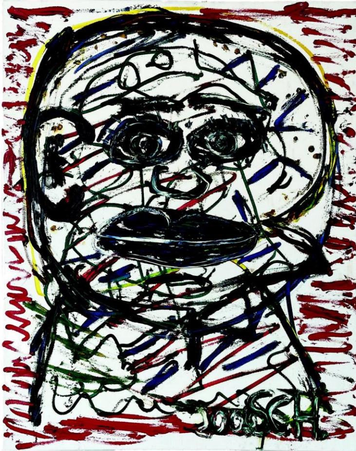
Karl-Heinz Schwind, o.T., 2010, Öl auf Leinwand, 101 x 70 cm