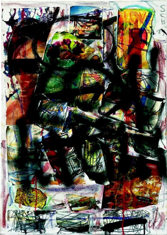
Karl-Heinz Schwind, o. T., 2011, Übermalung, Collage, Acryl auf Nessel, 71,5 x 50 cm