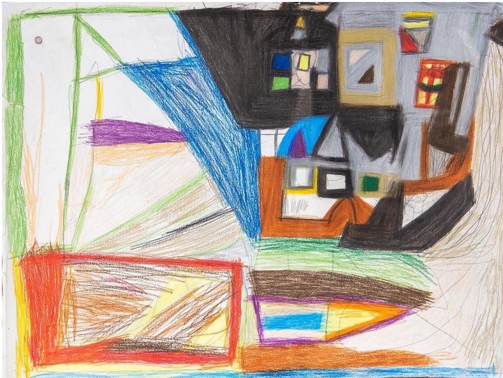
Hotel mit Badewanne und Vollpension, O.D., Buntstift und Bleistift, 51x38