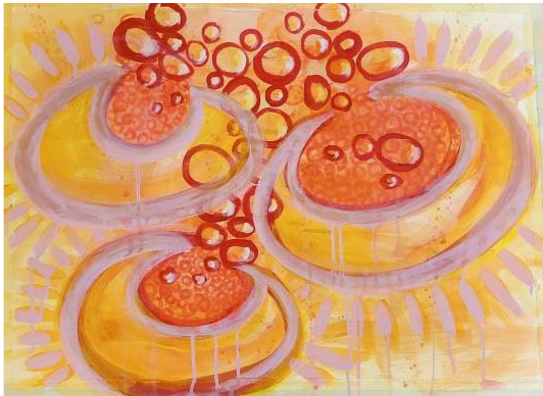
An der Grenze zur Abstraktion: eine Arbeit von Anne Dettmer, ohne Titel

An dem Herzstück der Ausstellung, dem großformatigen Acryl „Yggdrasil“, haben sich alle KünstlerInnen gemeinsam beteiligt.